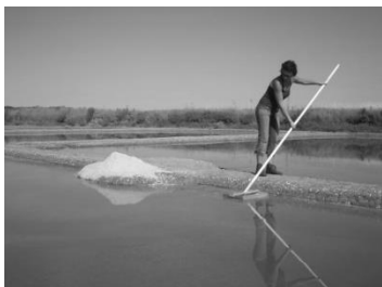
D'après OT La Turballe

Les marais salants permettent de produire du sel marin. Pour cela, on fait entrer de l'eau de mer dans des bassins de faible profondeur. Sous l'effet du soleil et du vent, l'eau s'évapore. On peut alors facilement récolter le sel marin.